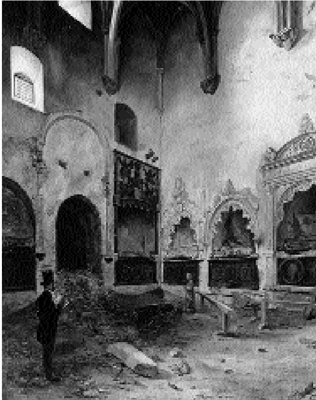
Cementerios, ruinas, iglesias, conventos... son escenarios característicos del Romanticismo. Monasterio tras la Desamortización, de Pizarro (1846).

□ ¿Podría encontrar la figura de este pirata romántico algún modelo social paralelo en el mundo de hoy (como sugerencia, fíjate que incluso se habla de piratas