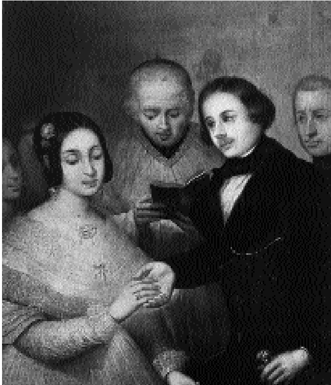
Las rimas de exaltación amorosa reflejan la idealización de los sentimientos y la expresión del amor pleno de los amantes hasta la unión absoluta. Boda, de Gutiérrez de la Vega.

□ Muchas estrofas de las rimas comienzan con prolongados hipérbatos: las subordinadas o complementos circunstanciales crean al principio un ambiente propicio hasta la aparición de los elementos sintácticos esenciales (obsérvalo también en el comienzo de la rima anterior). Es como si el poeta fuese descubriendo poco a poco, costosamente, el misterio de lo que quiere decir. Intenta justificarlo en este caso.