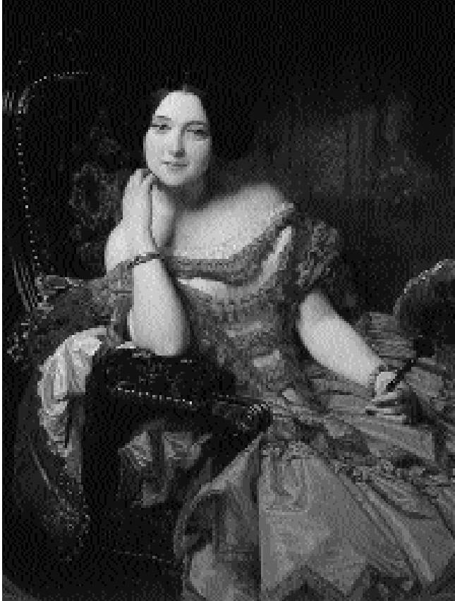
Misterio y belleza son para el poeta los atributos de esa mujer ideal e inalcanzable. La condesa de Vilches, de F. Madrazo.

❑ Analiza el efecto que produce en el último verso de la rima la suspensión y la brevedad que contrasta con los versos anteriores.