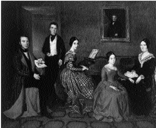
Al aludir a su poesía ideal, Bécquer toma la música como referencia. La familia de Flaquer, pintura del siglo XIX.

□ Bécquer subraya la imposibilidad de expresar con el lenguaje común la imprecisión y el misterio que rodean la experiencia del poeta. Parecida dificultad, lo dice el propio Bécquer, a la que experimentamos al contar un sueño. Para que lo compruebes, relata oralmente un sueño con el mayor número de detalles po-